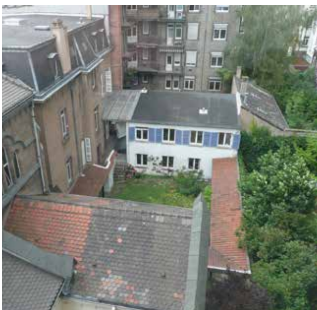
La cour enclavée