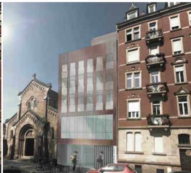
Le bâtiment Mounier demain

Le bâtiment Mounier avance harmonieusement, par le choix subtil d'une teinte unifiée avec l'église, sa rigueur orthonormée et sa verticalité, marquées par une vêtue à la fois rigoureuse, lisse et au calepinage aléatoire qui diffèrent de celle de l'église et dialogue avec elle, plus « rugueuse », puisque caractérisée par de multiples détails et aspérités à diverses échelles et au parement, lui, régulier.