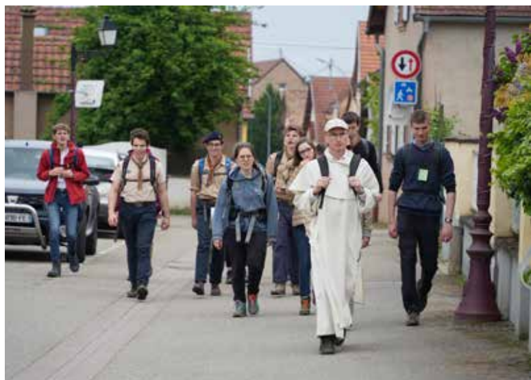
En route vers le mont Sainte-Odile