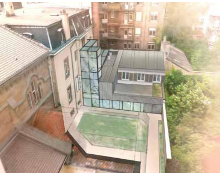
La future cour désenclavée

La restructuration du couvent des Dominicains et du bâtiment Mounier est l'occasion unique d'une harmonisation, d'un dialogue, et d'une réunification entre les bâtiments qui entourent l'église.