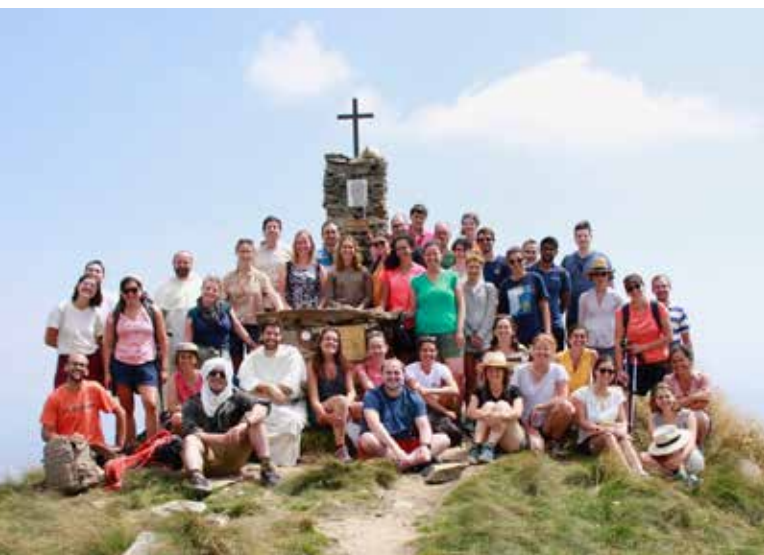
Sur les pas de saint Pier Giorgio Frassati avec les Frères

“Nous nous efforçons de parler de Dieu au plus grand nombre, partageant ainsi le fruit de notre contemplation.”