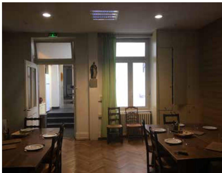
Le réfectoire actuel