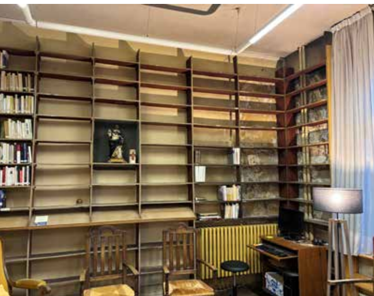
La bibliothèque et la salle commune hors d'usage

Autre défaut majeur : l'impossibilité d'accueillir des Frères en situation de handicap, par manque d'ascenseur, de chambre adaptée et de sanitaires appropriés. Enfin, les locaux sous la cuisine sont trop exigus et inaccessibles aux personnes à mobilité réduite.