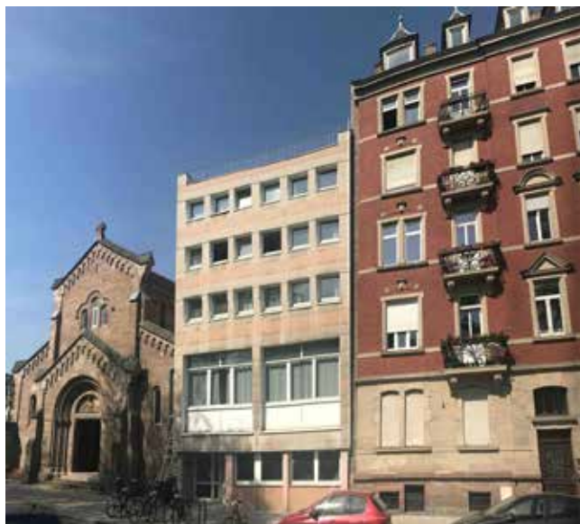
Le bâtiment Mounier hier