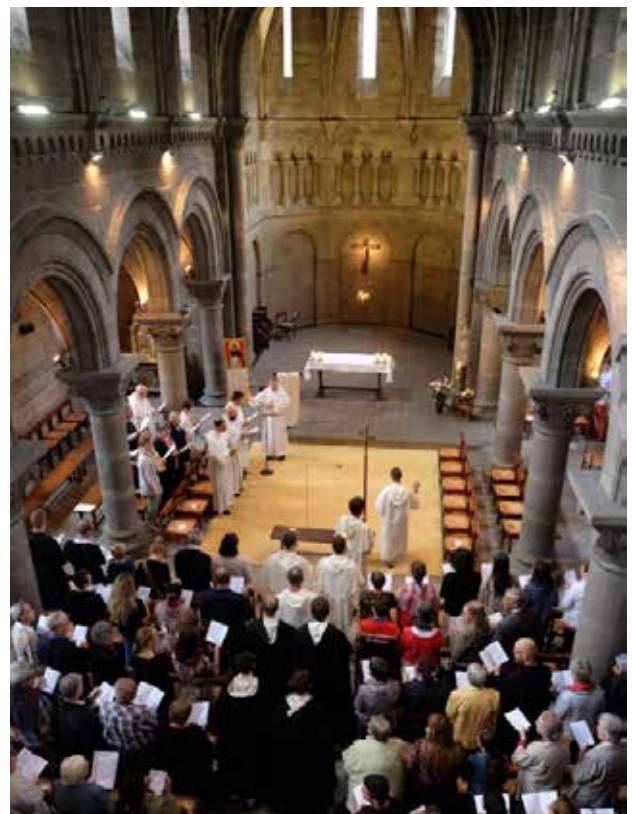
Église des Dominicains de Strasbourg