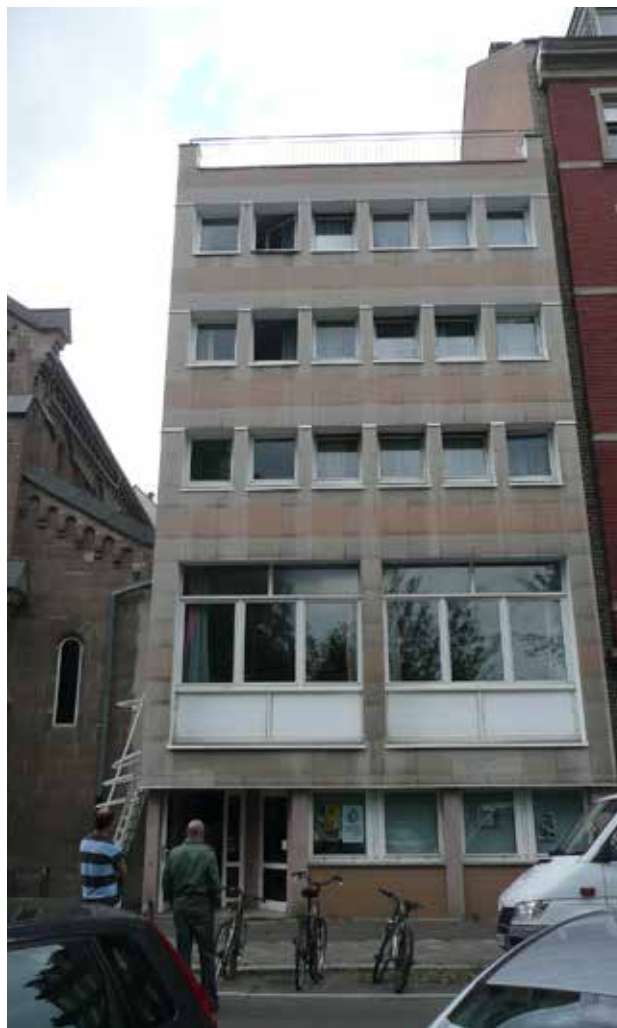
Le bâtiment Mounier inadapté aux normes actuelles

Ces espaces demandent une rénovation en profondeur: redimensionnement, correction acoustique, équipement technique et sanitaires adaptés et conformes aux évolutions réglementaires.