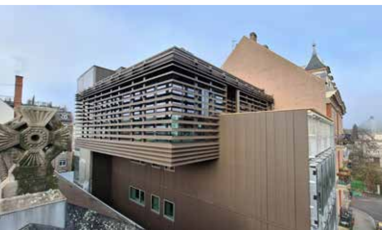
Salle spacieuse avec terrasse du bâtiment Mounier

Pour rendre le couvent accessible à tous, le projet prévoit: