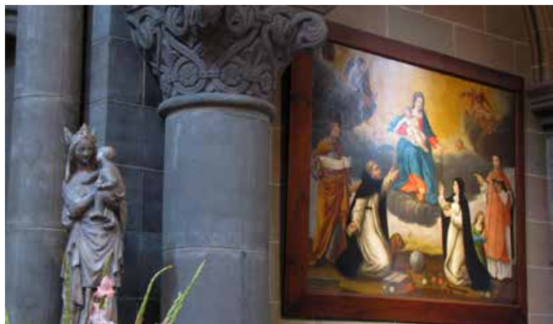
Église des Dominicains de Strasbourg

L'Ordre dominicain compte aujourd'hui environ 6 000 Frères et 3 000 moniales dans le monde. En France, près de 500 Frères sont répartis sur 19 couvents et environ 200 religieuses dans une douzaine de monastères.