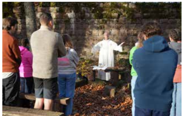
Pèlerinage des étudiants au mont Sainte-Odile