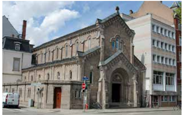
Le vieux bâtiment Mounier adossé à l'église

Les différentes activités des Frères retrouveront des espaces pour se déployer: salles de réunion et une grande salle de conférence.